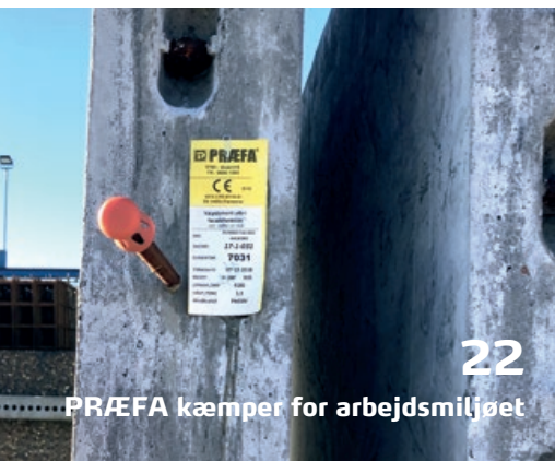
PRÆFA kæmper for arbejdsmiljøet