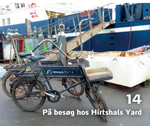
På besøg hos Hirtshals Yard