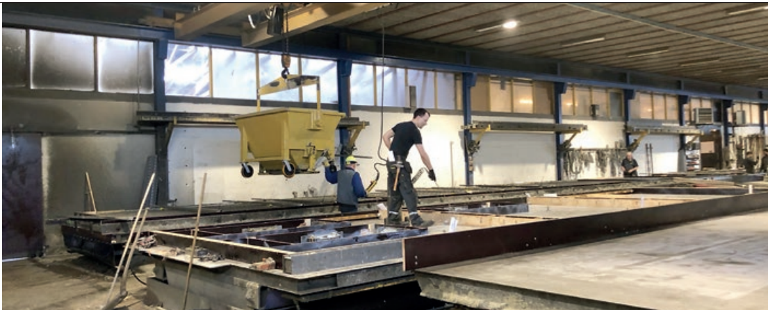
Betonstøberiet går i gang kl. 9 på PRÆFA.